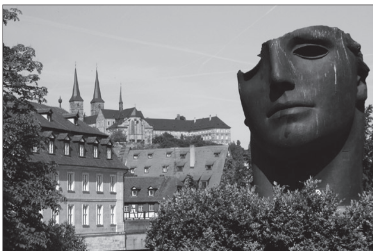
Blick auf den Michelsberg in Bamberg mit der Centurione-Figur des Bildhauers Igor Mitoraj

In der Bundesrepublik kann man nicht an Hungersnot sterben. Es gibt eine relativ hohe Ökonomie und ein gut funktionierendes Sozialwesen. Die Polizei beschützt ihre Bürger, sodass man spät am Abend noch auf die Straßen gehen kann. Für die Bundesbürger sind alle Grenzen offen, man kann alle Länder bereisen.