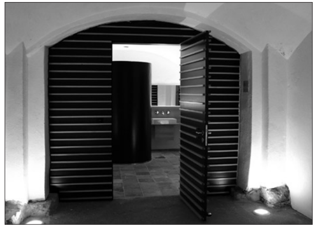
Vorraum der Mikwe

Seit der feierlichen Eröffnung unserer Neuen Synagoge im Sommer des vergangenen Jahres haben uns viele Schulklassen, aber auch zahlreiche Gruppen von Erwachsenen besucht, um unser Gemeindezentrum mit der Mikwe, dem Garten mit der Sukkah, der Wochentagssynagoge und natürlich der großen Hauptsynagoge zu sehen und dabei mehr über unsere Gemeinde und über das Judentum im allgemeinen zu erfahren. Das Interesse an den Synagogenführungen ist nach wie vor sehr groß; wir hatten nicht nur Gruppen aus Bamberg und der näheren oberfränkischen Umgebung zu Gast, sondern aus ganz Nordbayern und auch amerikanische Besucher der Fahrgastschiffe, die den Rhein-Main-Donau-Kanal von Passau nach Frankfurt bereisen.