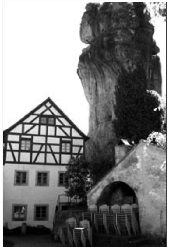
Der „Judenhof“ in Tüchersfeld, Ziel beim Ausflug des Synagogenchors in die Fränkische Schweiz.

(Fotos zum Thema: siehe Seite 1; Anmerkung der Redaktion.)