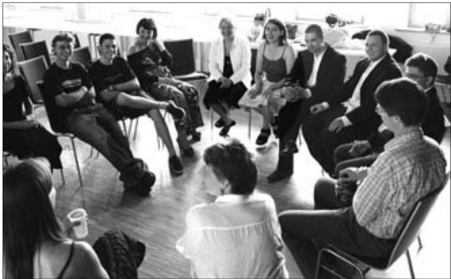
1. Juni 2008: Die Jugendtheatergruppe tritt für die Interreligiöse Fraueninitiative auf.

Einige Jugendliche nahmen schon mehrere Jahre zuvor an den traditionellen Purimspielen in der Gemeinde teil. Das Interesse am Theater war also da. Die Jugendlichen haben das Thema ausgesucht. Als Basis für die Szenerie wurde das Buch des amerikanischen Juden Leo Rosten genommen. Die jiddische Sprache fanden wir interessant. Leider ist diese Sprache heute fast verloren gegangen. Aber manche Begriffe sind immer noch gegenwärtig und im Sprachgebrauch zu finden. Nur weiß nicht jeder, dass sie aus dem Jiddischen stammen. Die erste Aufführung des