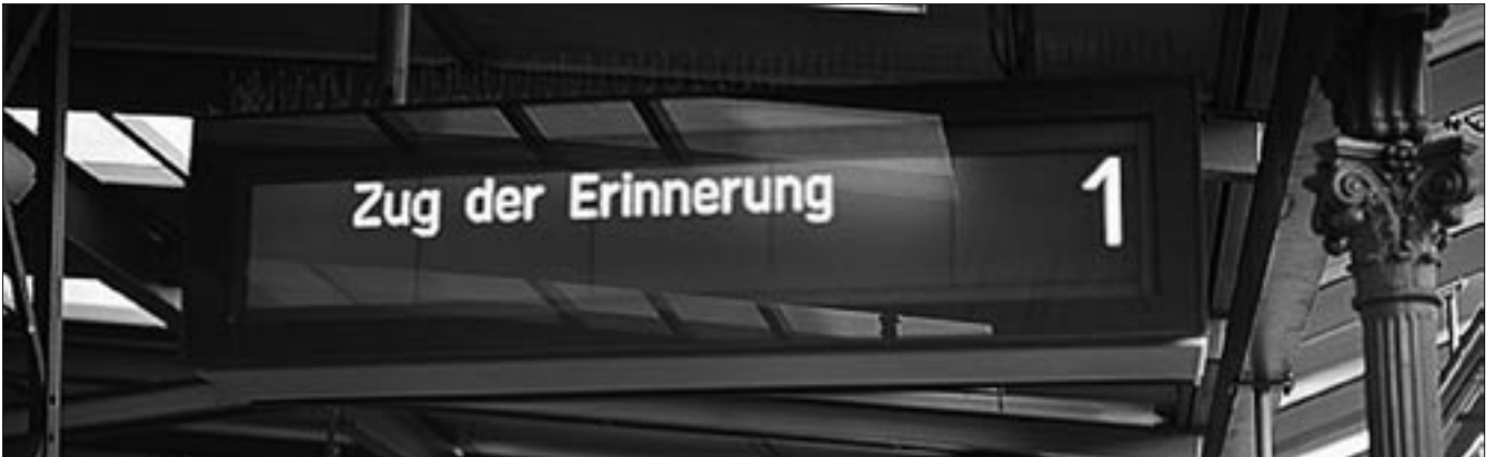
Eine wohl einmalige Anzeige auf dem Bamberger Bahnhof