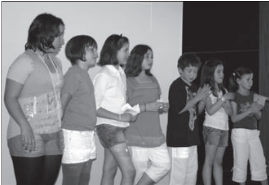
Die Kinder verdeutlichten in einer kleinen Szene die Bedeutung des Unabhängigkeitstages.

Auch wenn insgesamt nur wenige unserer Gemeindemitglieder kamen, so waren doch alle guter Dinge und ließen den Staat Israel und Jerusalem hochleben.