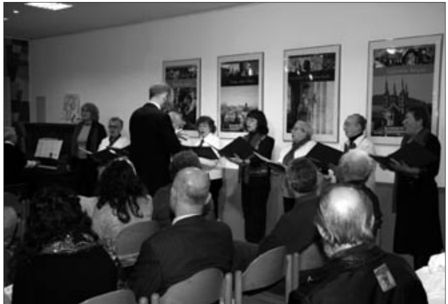
Der Kammerchor bei der Untermalung des Abschlusses der Woche der Brüderlichkeit im Pfarrsaal von St. Josef in Gaustadt

То, что первостепенным для синагогального хора является литургическое пение на богослужении, не является предметом дискуссии. Поэтому хор в первый шаббат месяца обязательно присутствует на богослужениях, чтобы вместе с общиной петь и молиться. Перед лицом общественности хор представил себя достойно также и 17 мая 2009 в общинном зале имени Вилли Лессинга еврейской общины Бамберга.