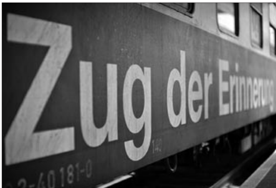
Der „Zug der Erinnerung“ an Gleis 1 des Bahnhofs Bamberg

Handeln im Sinne der Menschen. Sie lassen diesen Zug mit den Geschichten, Namen und Gesichtern der deportierten Opfer des Nationalsozialismus durch unsere junge Republik fahren und schenken uns damit