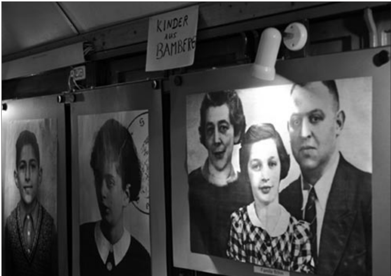
Fotos jüdischer Kinder und Familien aus Bamberg, die verschleppt wurden und in Vernichtungslagern umkamen, im „Zug der Erinnerung“.

Leider unterstützt die Bahn die rollende Ausstellung nicht. Im Gegenteil: Sie verlangt für das Benutzen der Gleise und Bahnsteige Gebühren. Der Vorstand der Bahn hat einen Kostenerlass abgelehnt. Auch das Berliner Verkehrsministerium