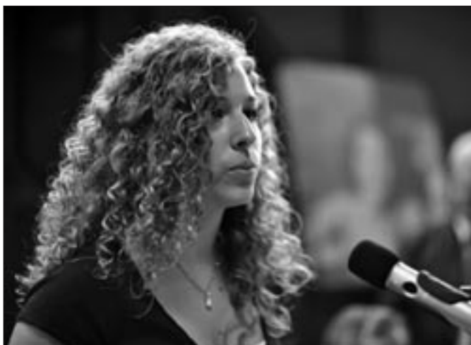
Diese Schülerin der Maria-Ward-Realschule in Bamberg gestaltete die Eröffnung der Ausstellung „Zug der Erinnerung“ in Bamberg mit.